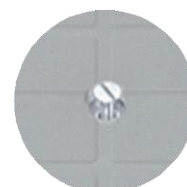
Dettaglio apertura con bullone sul modello 55x55 cm