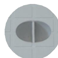
Elemento di presa del chiusino